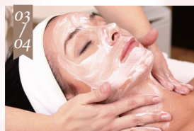
汚れ・くすみをクリア