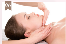
至福のリフトアップマッサージ