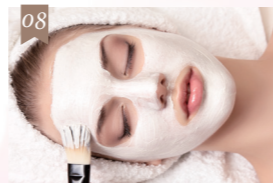
肌別でパックチョイス